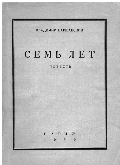
Обложка книги Владимира Варшавского «Семь лет» (Париж, 1950)

Однако было бы ошибкой считать, что участие Варшавского во Второй мировой войне против нацистской Германии было только плодом стороннего влияния. Желание стать резервистом Французской армии — следствие этико-онтологической установки самого писателя, своеобразный итог его понимания места эмигрантского молодого человека в мире. Опыт младших эмигрантов Варшавский четко отделял от опыта старших, замечая, что «конечно, и они были эмигранты, но только мне казалось, что их эмигрантство другого рода, менее полное, чем наше» [Варшавский 1950, с. 27]. В цикле статей, написанных в межвоенный период, он выведет архетип «эмигрантского молодого человека», в котором явственно виден прообраз «незамеченного поколения». Это «голый человек на голой земле» [Варшавский 1936, с. 410], или «это действительно как бы “голый” человек, и на нем нет “ни кожи от зверя, ни шерсти от овцы”» [Варшавский 1932, с. 164], или человек, который «оторван от тела своего народа и не находится ни в каком мире, ни в каком месте» [Варшавский 1930/31, с. 221]. В то же время именно из-за своей тотальной отверженности от внешнего мира эмигрантский молодой человек, в понимании писателя, был способен «искать вокруг себя и в себе истинную жизнь еще с большей силой» [Там же, с. 217], т. е. мог начать всё с чистого листа. Так сложилось, что становление писателя, как и его поколения в целом, пришлось на один из